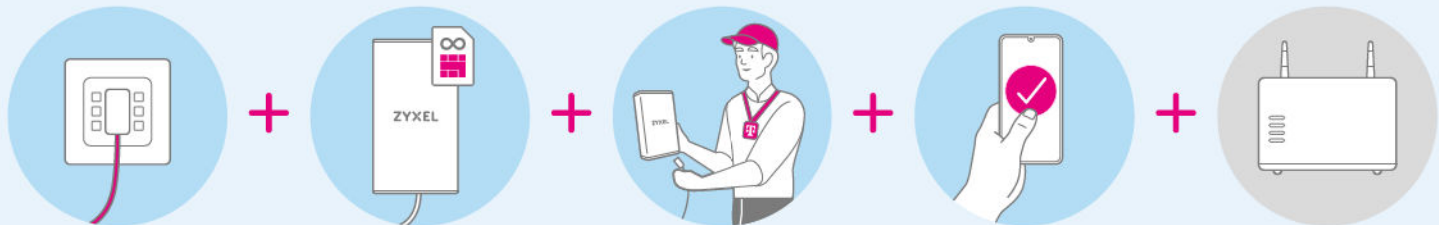
Business Glasfaser Tarif