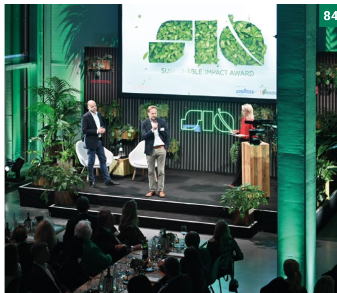
Sustainable Impact Award 2024