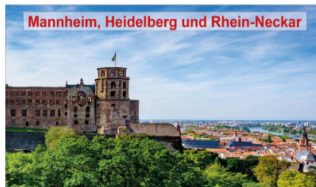
Mannheim, Heidelberg und Rhein-Neckar