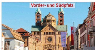
Vorder- und Südpfalz