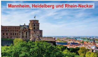
Mannheim, Heidelberg und Rhein-Neckar