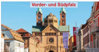
Vorder- und Südpfalz